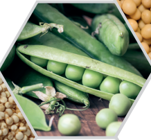
PETIT POIS VERT