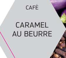
CARAMEL AU BEURRE