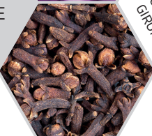
CLOU DE GIROFLE