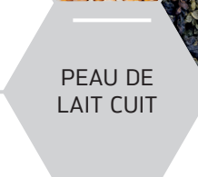
PEAU DE LAIT CUIT