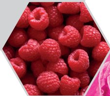
EAU DE ROSE