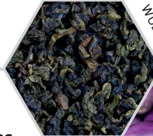
THÉ WU LONG