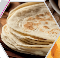
TORTILLA DE MAÏS