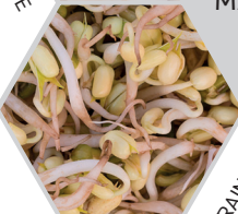
GRAINES DE SOJA GERMEES